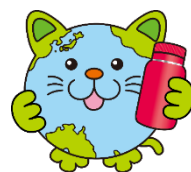
新潟県3R推進 キャラクター 「エコニャン」